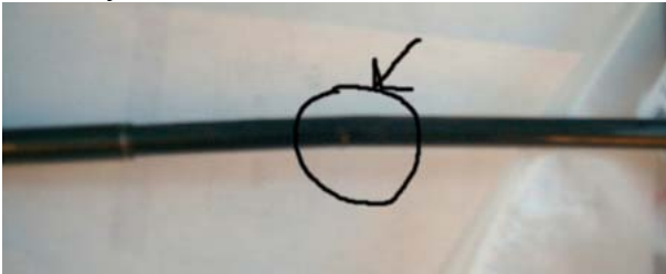
Фото 1. Не очень заметно, но я пытался проиллюстрировать изгиб.

С чего же начать? Во-первых, без паники. Во-вторых, осмотрите телескопическую антенну.